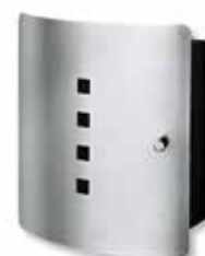
Quad 6204/10 Ni