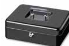
Money 5025 S