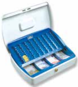
ZK 2307 EURO

Komplett mit EURO-Einsatz für Banknoten und Münzen. Aufgrund der flachen Bauweise passt diese Kassette hervorragend in Schubladen. Münzeinsatz kann in den geöffneten Deckel hochgestellt werden. Der Einsatz ist herausnehmbar.