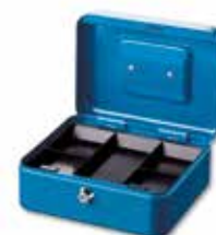
Money 5020 BL