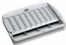
ZE 300 EURO

Kassetten- und Schubladeneinsätze für Banknoten und Münzen.