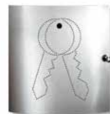
Como 6401/22 Ni