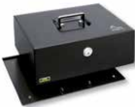
Royal 300 A