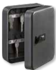
KC 20 C

Schlüsselbox Abschließbare Schlüsselbox mit Zahlenschloss. Edle Lackierung in Matt-Schwarz.