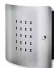
Slot 6220/10 Ni