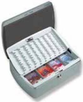
ZK 7300 EURO

Komplett mit EURO-Einsatz für Banknoten und Münzen. Münzeinsatz kann in den geöffneten Deckel hochgestellt werden. Mit separatem Fach für Münzrollen. Der Einsatz ist herausnehmbar. Eine Schaumstoff-Einlage sichert die Münzen beim Transport.