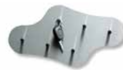
Nuvola 6400/6 Ni