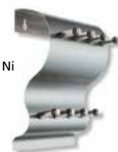
Varese 6400/8 Ni