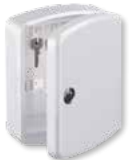
KB 15 W

Key-Box Preiswerte Schlüsselbox in softly abgerundeter Form. Farben: S: Schwarz W: Weiß